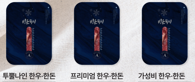
투빨나인 한우·한돈 프리미엄 한우·한돈 가성비 한우·한돈