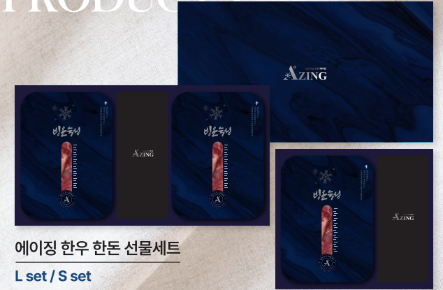
에이징 한우 한돈 선물세트 L set / S set